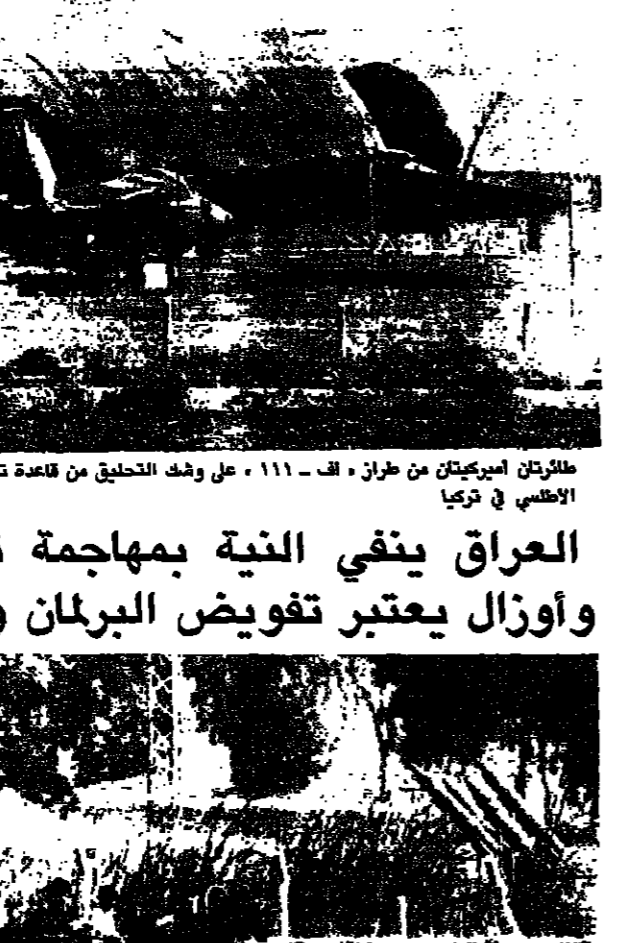
مركبات بصرية بريطانية تروج القربا على من كسحت الغم تغار ميناء سكيكتنديا